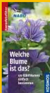
Buch Welche Blume ist das? Von Eva-Maria und Wolfgang Dreyer 14,20 Euro