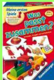
Spiel Was passt zusammen? Für Kinder ab 2 Jahren