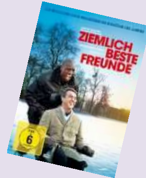
Ziemlich beste Freunde Ab 6 Jahren 7,40 Euro