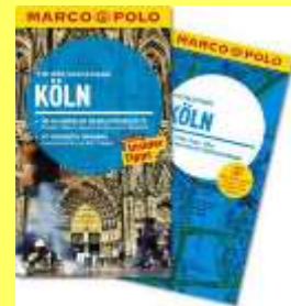
Reiseführer Köln 128 Seiten