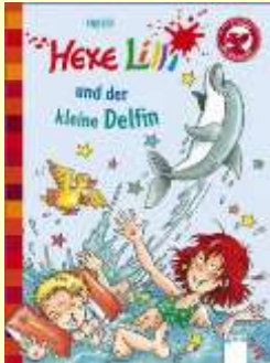
Kinderbuch Hexe Lilli und der kleine Delfin