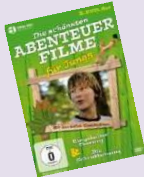
Die schönsten Abenteuerfilme für Jungs Ab 0 Jahren 4,20 Euro