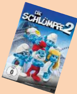
Die Schlümpfe 2 Ab 0 Jahren 5,50 Euro