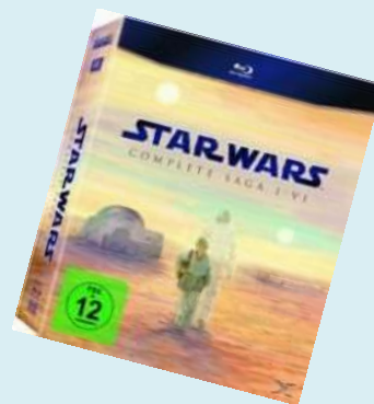
Star Wars Ab 12 Jahren 9,99 Euro