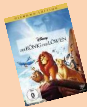
Der König der Löwen Ab 0 Jahren 6 Euro