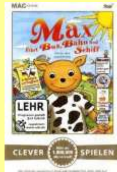
CD-Rom Max fährt Bus, Bahn und Schiff